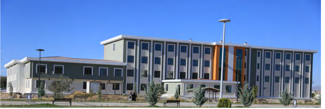
Resim 3. Yemekhane Binası