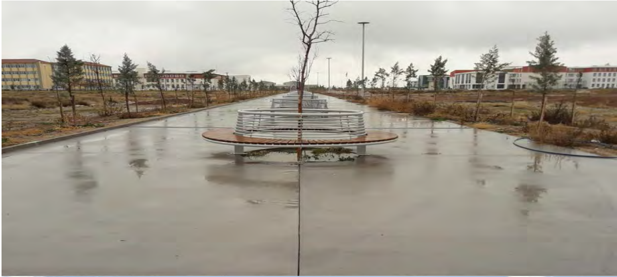
Resim 4. Kampüs Altyapı Projesi