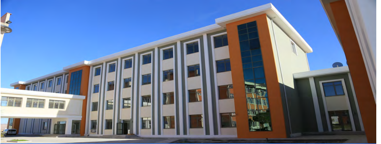
Resim 2. Fen Edebiyat Fakültesi Ek Binası