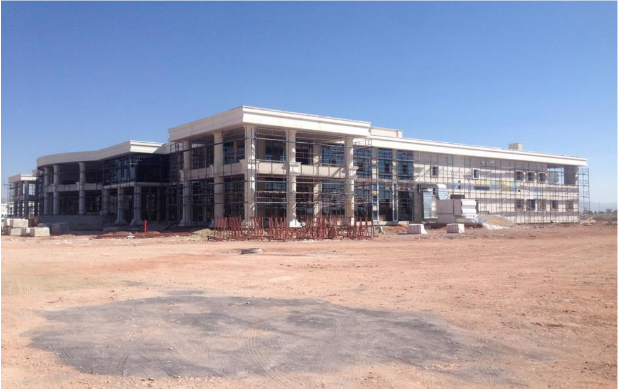
Resim – 2 Yemekhane Binası İnşaatı