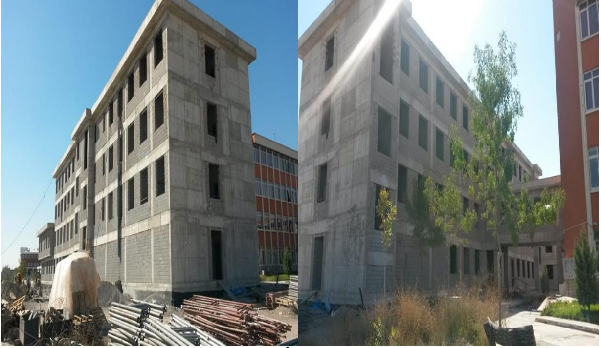
Resim - 1 Fen Edebiyat Fakültesi Ek Bina İnşaatı